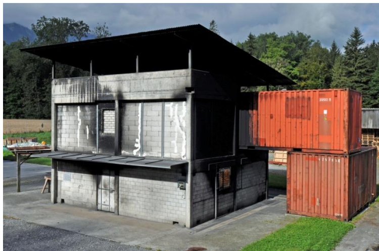
RFA Thoune - Allmendingen

Seul le bois mentionné au chapitre 2.2 peut être utilisé comme carburant (pas de palettes CFF ou EURO)