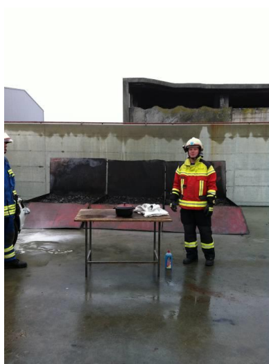
Centre de formation pour la sécurité de Büren