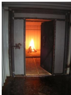
Centre de formation pour la sécurité de Büren