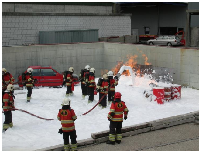
Centre de formation pour la sécurité de Büren

Les installations doivent être vérifiées ou entretenues régulièrement selon les indications du fabricant.