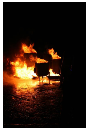
RFA Thoune - Allmendingen