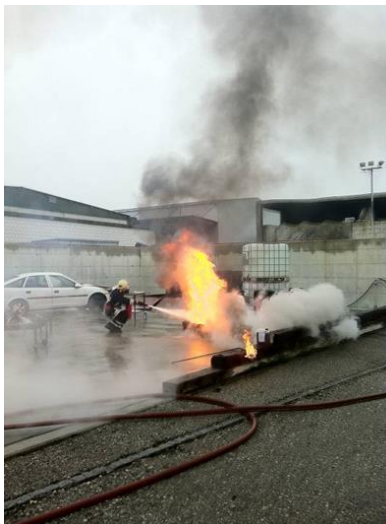
Centre de formation pour la sécurité de Büren