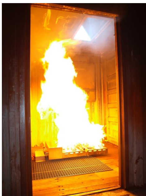
Installation de formation au feu de Köniz

Les installations doivent être vérifiées et entretenues régulièrement selon les indications du fabricant.